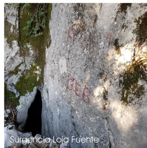
Surgencia Loja Fuente