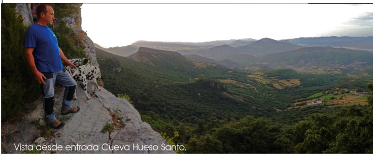
Vista desde entrada Cueva Hueso Santo.