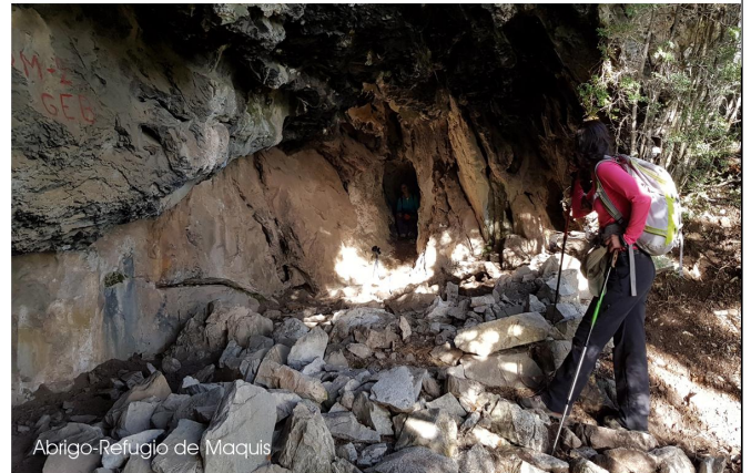
Abrigo-Refugio de Maquis

Tras la surgencia de Lojafuente, de la que toma el agua por acequia el monasterio, llegamos a la cueva de Hueso Santo. Llevar linternas y ropa para ensuciar si queremos visitarla. El interior es emocionante, con una galería de unos 200m donde se anda de pie y con toboganes resbaladizos al final (atención). Posiblemente las concreciones blanquecinas de carbonatos tengan que ver con su nombre.