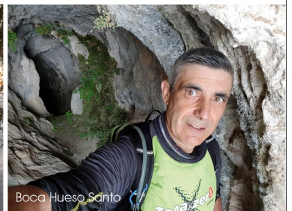
Boca Hueso Santo