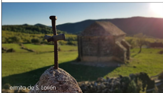
ermita de S. Lorién